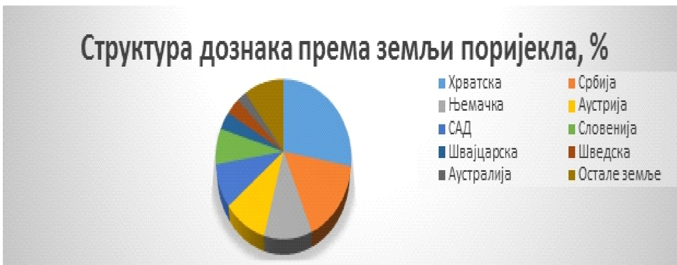
График 1. Структура дознака према земљи поријекла у процентима (Публикација „Cost of Youth Emigration from Bosnia and Herzegovina“ у издању Westminster Foundation for Democracy [WFD], 2020) Graph 1. Structure of remittances by country of origin in percentages (Publication “Cost of Youth Emigration from Bosnia and Herzegovina” published by the Westminster Foundation for Democracy [WFD], 2020)

Према подацима ЦББиХ у периоду од 2004. до 2019. године дознаке износили су 37.852.000.000,00 КМ. Износ дознака би био много већи када би постојала могућност статистичког обухватања дознака које неформалним путем стижу у земљу. Сматра се да је износ таквих средстава велики, нарочито због чињенице да 78,6% дознака долази из европских земаља, а 51,1% из Хрватске, Србије и Словеније, што указује да постоје велике могућности достављања средстава неформалним путем.