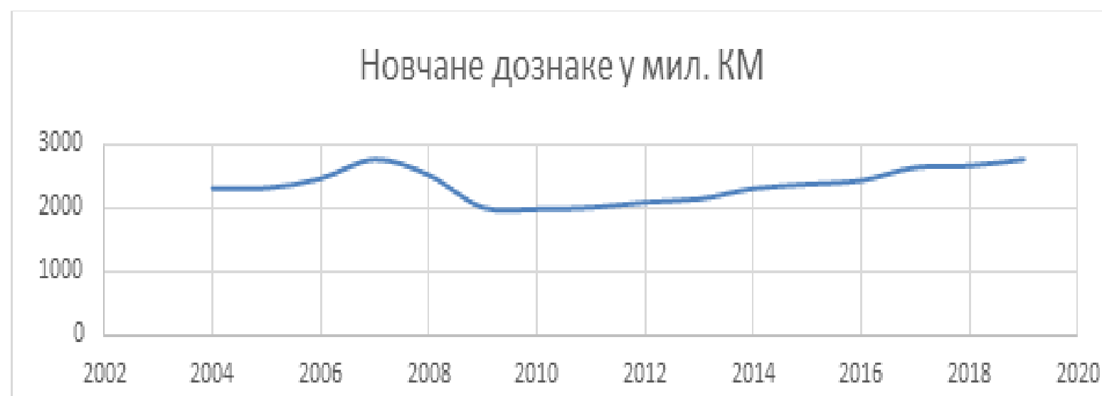
График 2. Новчане дознаке исељеништва од 2004. до 2019. године према подацима ЦББиХ у милионима КМ (Калкулација аутора) Graph 2. Remittances of emigrants from 2004 to 2019 according to the CBBIH data in millions of KM (Author's calculation)

Дознаке из иностранства представљају стабилан извор прихода за Босну и Херцеговину. Смањење новчаних дознака у периоду 2008-2010. резултат је утицаја свјетске економске кризе.